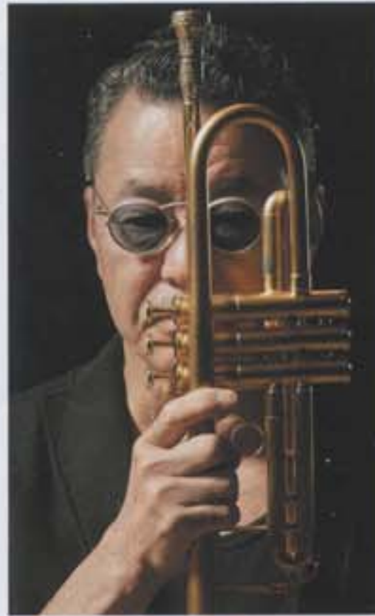
trumpet 日野 皓正

1942年10月25日東京生まれ。9歳よりトランペットをはじめ、13歳の頃には米軍キャンプのダンスバンドで活動を始める。1967年の初リーダーアルバムをリリース以降、マスコミに「ヒノテル・ブーム」と騒がれるほどの注目を集め、国内外のツアーやフェスティバルへの出演をはじめ、雑誌の表紙を飾るなどファッションブルなミュージシャンとして多方面で活躍。1975年、NYへ渡り居をかまえ、数多くのミュージシャンと活動を共にする。その後もヒットアルバムを連発、CM出演など多数。1989年にはジャズの名門レーベル「ブルーノート」と日本人初の契約アーティストとなる。90年以降、「アジアを一つに」という自身の夢のもと、アジア各国での活動を増やしていく。2001年芸術選奨「文部科学大臣賞」受賞。2004年紫綬褒章、文化庁芸術祭「レコード部門 優秀賞」、毎日映画コンクール「音楽賞」受賞。現在、dj honda、次男 日野JINO賢二を迎えたユニット「日野皓正 h factor」にてライブを行う他、同ユニットにてニューアルバム「Unity-h factor」を2013年6月に発売。また近年はチャリティー活動や後進の指導にも情熱を注ぎ、個展や画集の出版など絵画の分野でも活躍が著しい。唯一無二のオリジナリティと芸術性の高さを誇る日本を代表する国際的アーティストである。